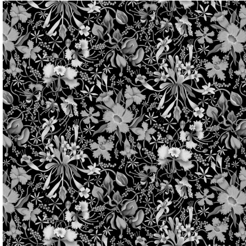
Bunga - Bunga di Kampus Ganesha - 2023 Digital illustration

Pattern Design/Batik Portfolio (2022-2024)