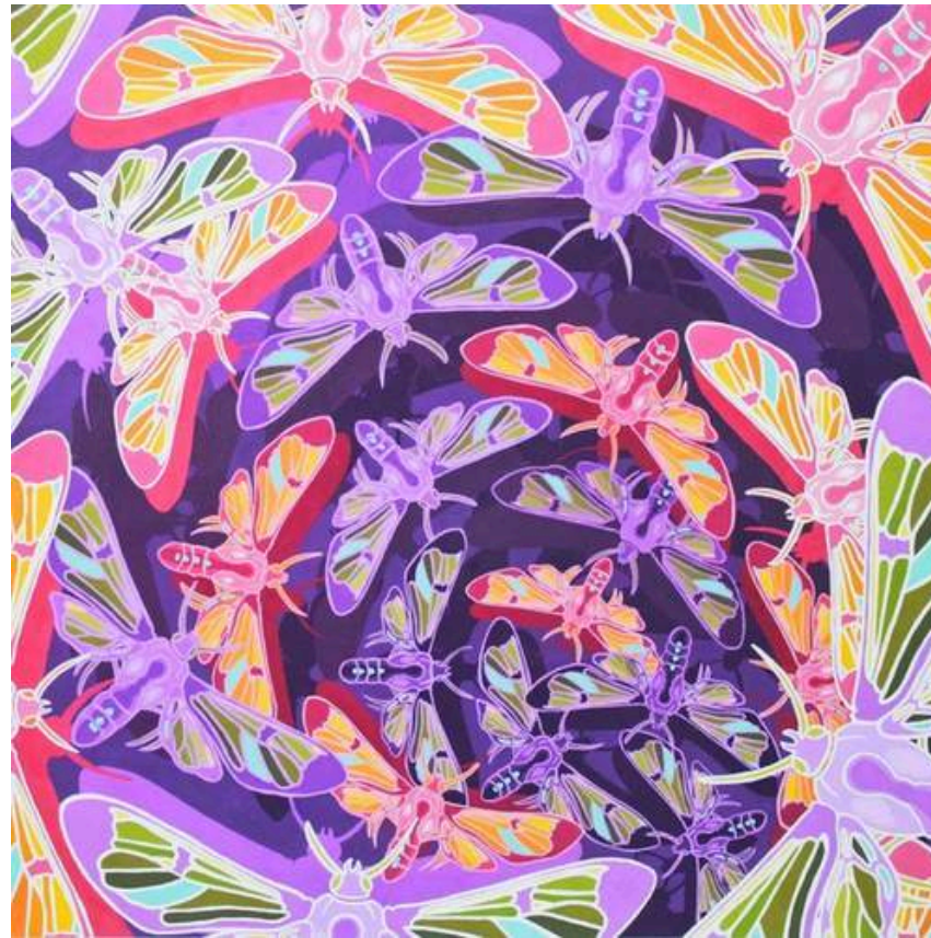
Cosmosoma Myodora - 2024 Poster Color on Concorde Paper 45 x 45 cm

Pattern Design/Batik Portfolio (2022-2024)