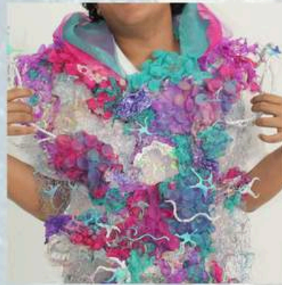
Once Upon a Time in a Future - 2023