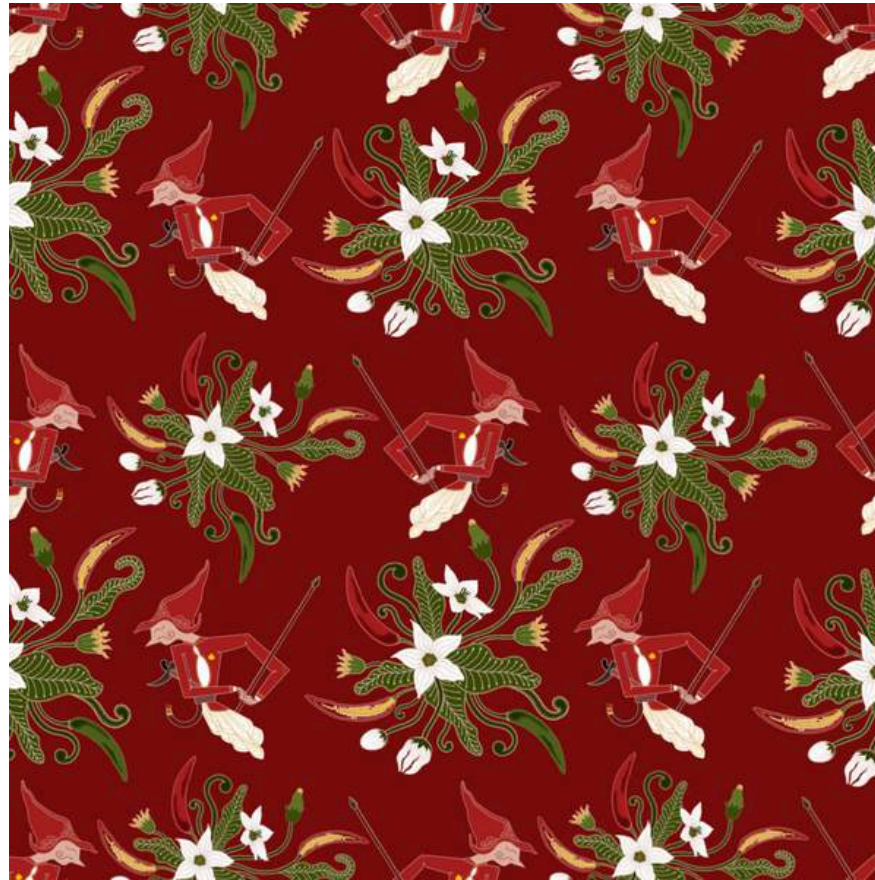
Prajurit Lombok Abang - 2023 Digital illustration

Pattern Design/Batik Portfolio (2022-2024)