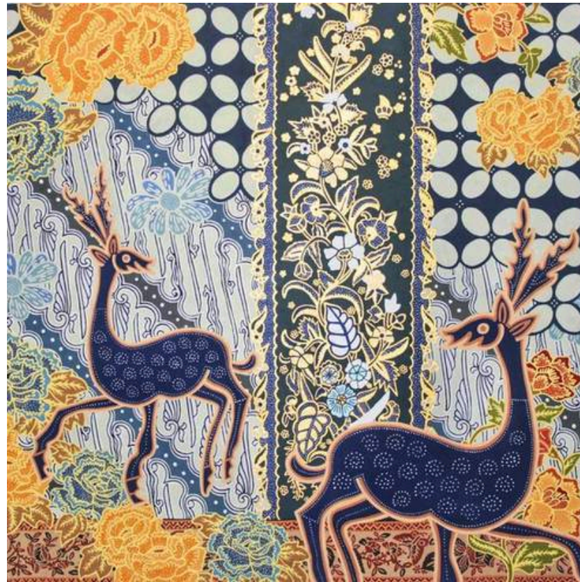
Jenggala Abhirama - 2023 oster Color on Concorde Paper 45 x 45 cm

Pattern Design/Batik Portfolio (2022-2024)